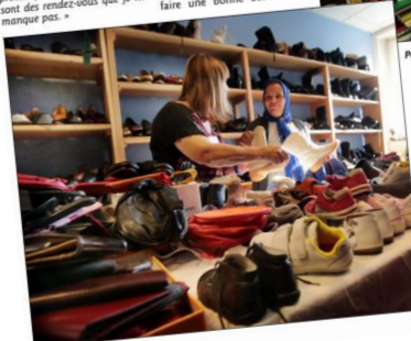
A la Friperie Saint-Nicolas, il y a de quoi se vêtir de la tête aux pieds !

C'est le nombre de bénévoles qui donnent de leur temps et de leur énergie pour que la vente puisse avoir lieu. Dès samedi dernier, ils se sont activés pour vider les cartons et tout ranger par catégorie. Un travail titanesque !