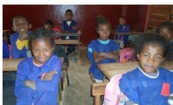
une classe de l'école aidée