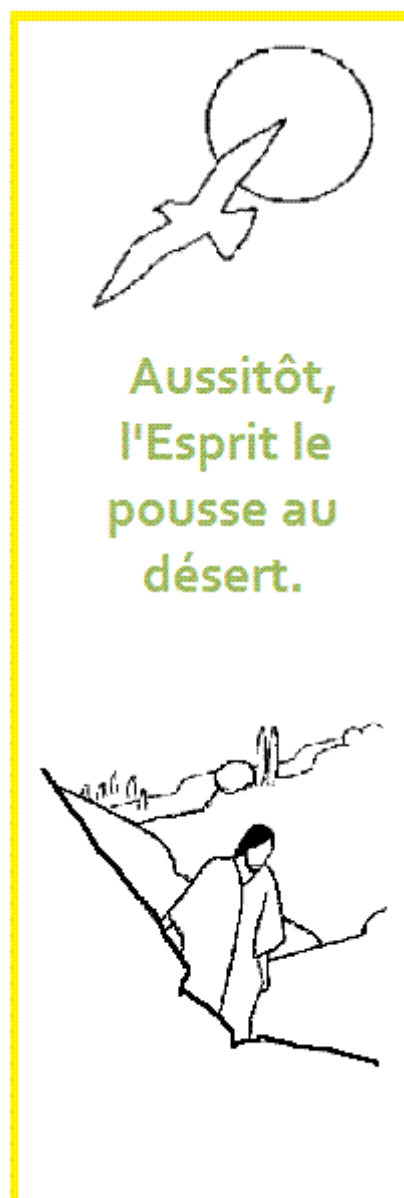
Jésus au désert