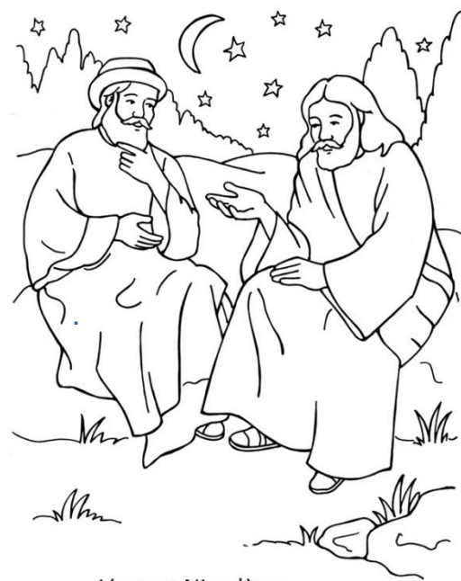
Jésus et Nicodème

En ce temps-là, Jésus disait à Nicodème : « De même que le serpent de bronze fut élevé par Moïse dans le désert, ainsi faut-il que le Fils de l'homme soit élevé, afin qu'en lui tout homme qui croit ait la vie éternelle. Car Dieu a tellement aimé le monde qu'il a donné son Fils unique, afin que quiconque croit en lui ne se perde pas, mais obtienne la vie éternelle. Car Dieu a envoyé son Fils dans le monde, non pas pour juger le monde, mais pour que, par lui, le monde soit sauvé. Celui qui croit en lui échappe au Jugement, celui qui ne croit pas est déjà jugé, du fait qu'il n'a pas cru au nom du Fils unique de Dieu. Et le Jugement, le voici : la lumière est venue dans le monde, et les hommes ont préféré les ténèbres à la lumière, parce que leurs œuvres étaient mauvaises. Celui qui fait le mal déteste la lumière : il ne vient pas à la lumière, de peur que ses œuvres ne soient dénoncées ; mais celui qui fait la vérité vient à la lumière, pour qu'il soit manifeste que ses œuvres ont été accomplies en union avec Dieu »